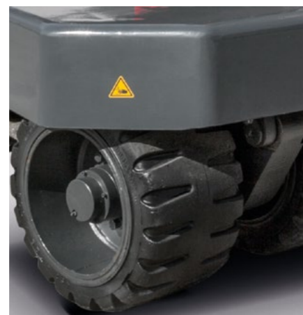
Elastikbandagen mit oder ohne Profil für unebene Böden und Außeneinsatz