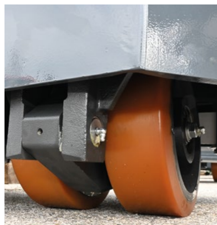
Vulkollan (PU) für glatte Industrieböden